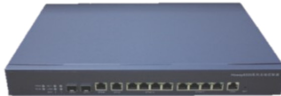
(图一)Howay AC-32 无线控制器

Howay AC-32 无线局域网控制器（图一）支持 8 个千兆电口+2 个千兆光口+2 个千兆电口，固定可管理 32 个 AP，不支持扩展，为小型和中小型企业提供具有成本效益的解决方案。